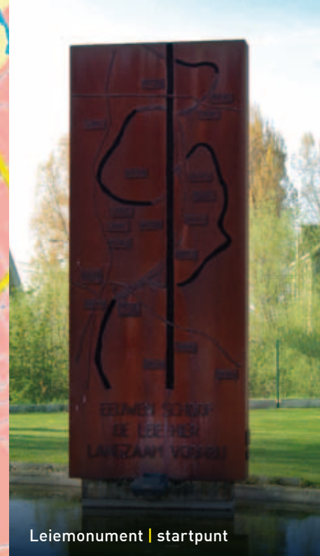
Leiemonument | startpunt

Wandelpad Neerhoek - Mei 1940 | De lengte van de wandeling bedraagt ca. 8.1 km. | 16 gedenkpunten